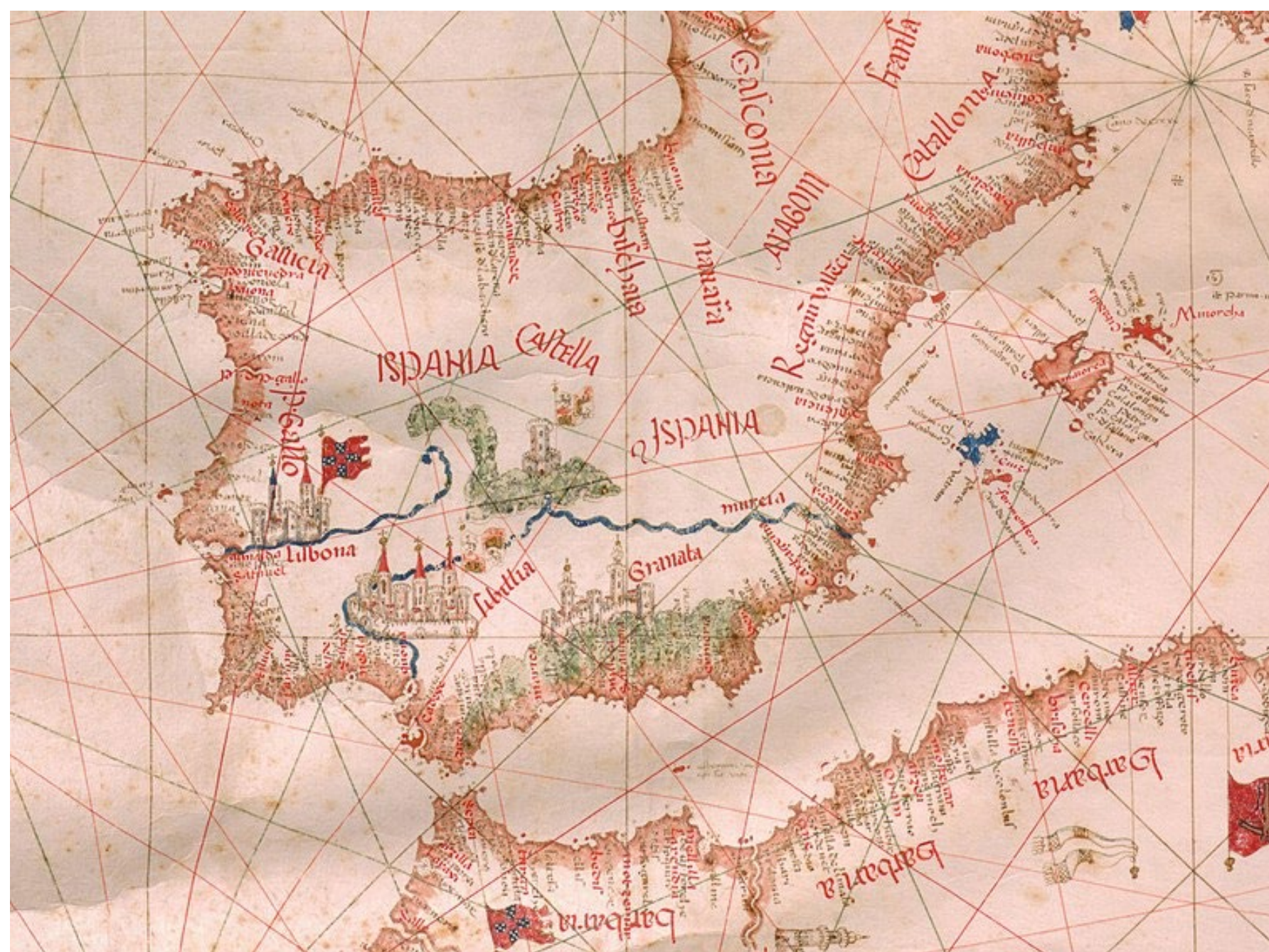
Fragmento do portolano de Bartolomeo Pareto (1455)